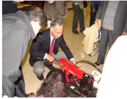
手回し発電の体験