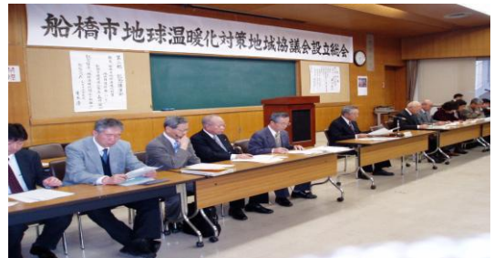
協議会役員の皆さん