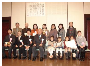
受賞された皆さま