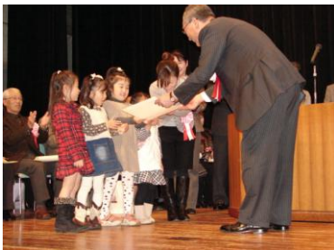
藤代市長から表彰される 「みそら保育園」の園児達