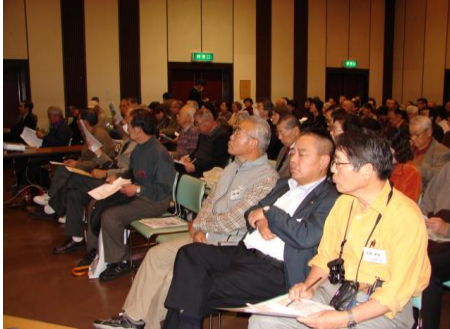
講演に聞き入る参加者

緑のカーテンコンクール表彰式」に続いて「県民環境講座」が開催されました。当協議会の研修会として位置づけ、会員に参加を呼び掛けた同講座では、『家庭でできる温暖化対策』をテーマに講演会と体験事例発表およびグループに分かれての手回し発電などの体験学習とグループ討議が行われました。参加者の皆さんは解説者の話に熱心に耳を傾けたり、熱いグループ討議を展開するなど、会場は熱気に満ちておりました。