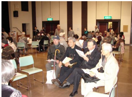
参加者によるグループ討議